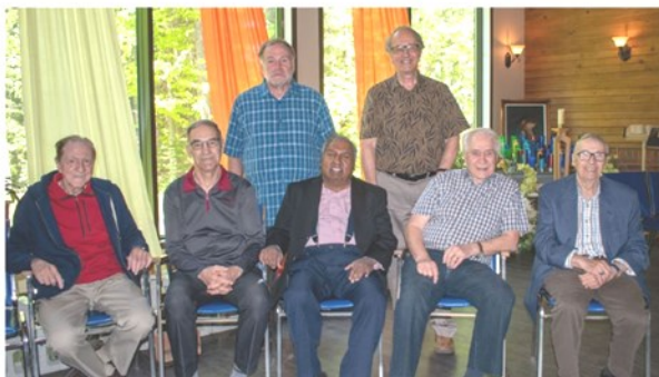
Comité sectoriel des hommes