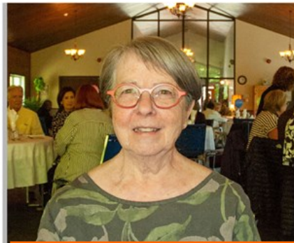
Responsable de la chaîne électronique Est et Ouest du secteur