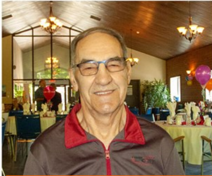
Représentant de l'AREQ Comité des conférences de la TRARA