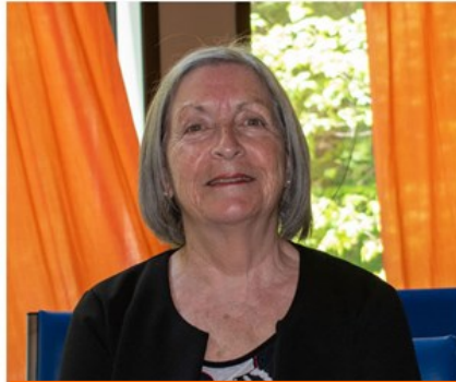
Responsable de l'inscription des personnes Amies de l'AREQ