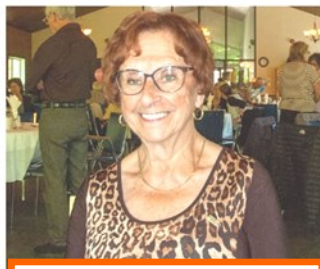
Représentante de l'AREQ Parole aux aînés d'Argenteuil