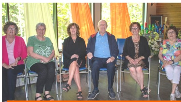
Comité des Arts