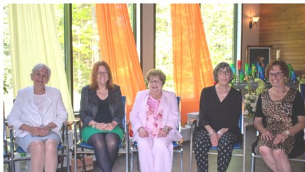
Comité organisateur des activités de l'Ouest du secteur