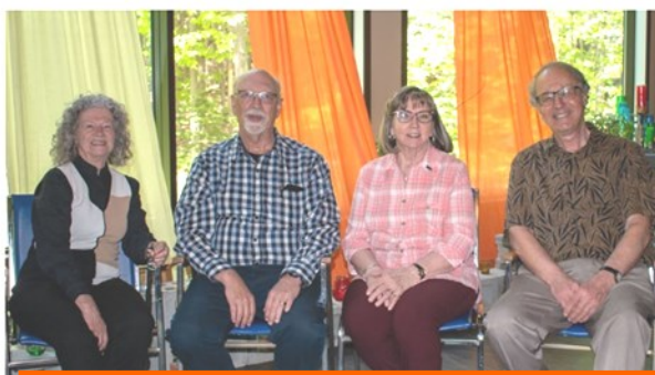
Responsables Bulletin l'Odysée