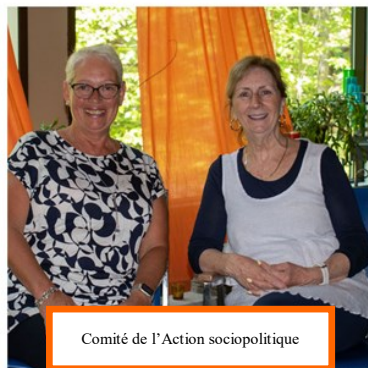
Comité de l'Action sociopolitique