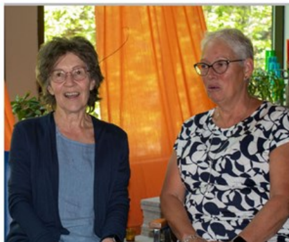
Responsable des civilités dans l'Ouest du secteur