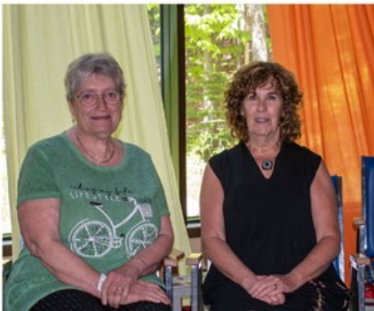
Responsable comité des Arts