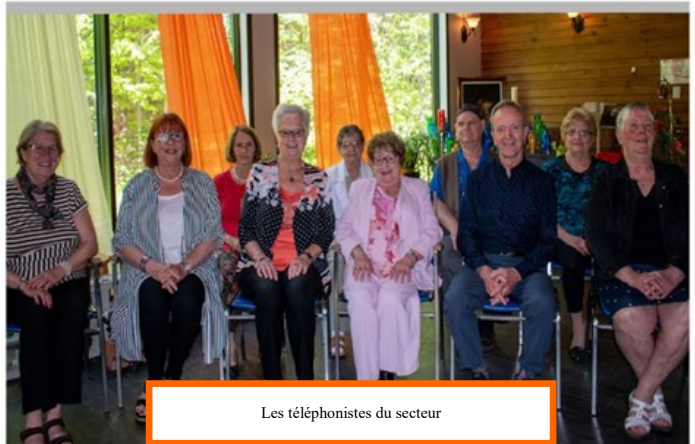
Les téléphonistes du secteur