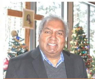
Responsable du comité des Hommes