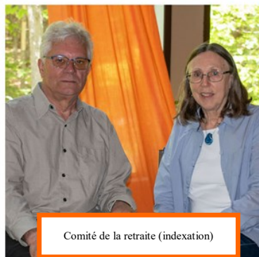
Comité de la retraite (indexation)