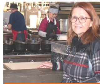
Réseau des femmes des Laurentides