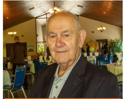
Comité des assurances