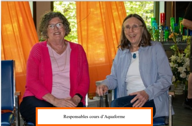
Responsables cours d'Aquaforme