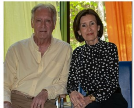
Responsable des déjeuners de l'Est