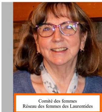
Comité des femmes Réseau des femmes des Laurentides