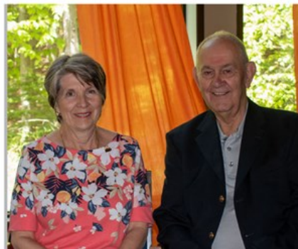
Comité des assurances