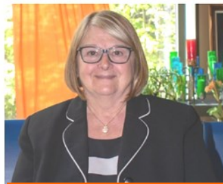
Publicité Grands Explorateurs