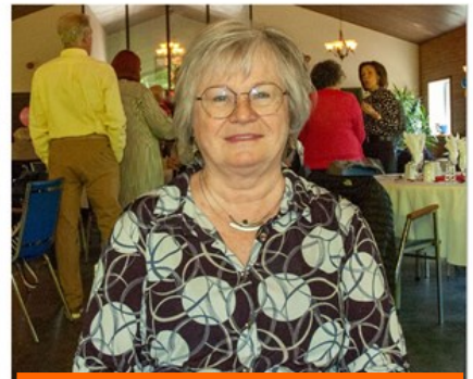
Webmestre sectorielle et régionale