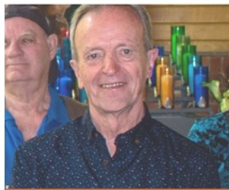
Responsable des téléphonistes de l'Est