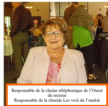
Responsable de la chaîne téléphonique de l'Ouest du secteur Responsable de la chorale Les voix de l'amitié