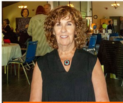
Responsable du comité des Arts cartes anniversaires 80 ans + et 25 ans de retraite