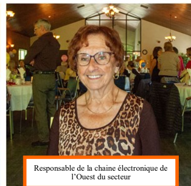
Responsable de la chaîne électronique de l'Ouest du secteur