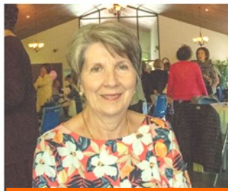
Représentante de la TRARA RDN