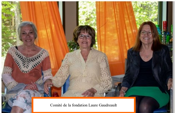
Comité de la fondation Laure Gaudreault