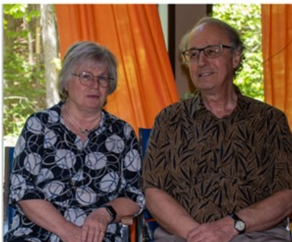
Responsable des communications