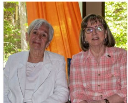
Responsable du comité de l'Environnement